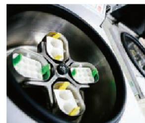
最先端の研究だから、遠心分離器などのシステムも最新式。